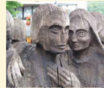
„Warten auf den Regenbogen“

Die Stadt Plettenberg liegt zwischen dem Lennegebirge und dem Ebbegebirge im Osten des Sauerlandes im Märkischen Kreis. Sie ist die walddreichste Stadt des Märkischen Kreises und gliedert sich in die insgesamt fünf Ortsteile Stadtmitte, Oestertal, Eiringhausen, Ohle und Holthausen.