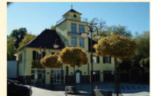
Jugendzentrum in der Alten Feuerwache